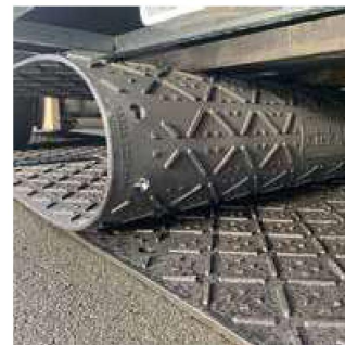
Bruchstabil & Biegefähig