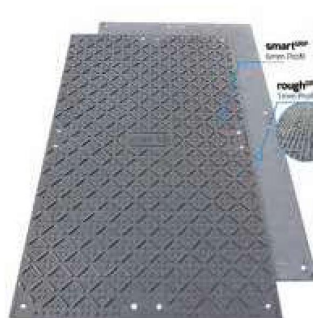
6mm | 1mm