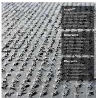
1mm RoughGrip Profil