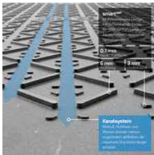
6mm SmartGrip Profil