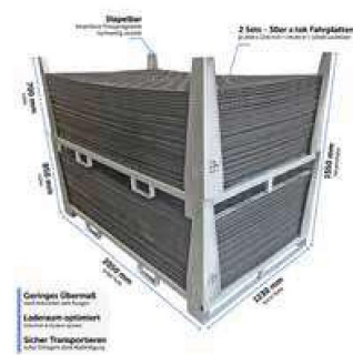
Stapelbar & Laderaumoptimiert